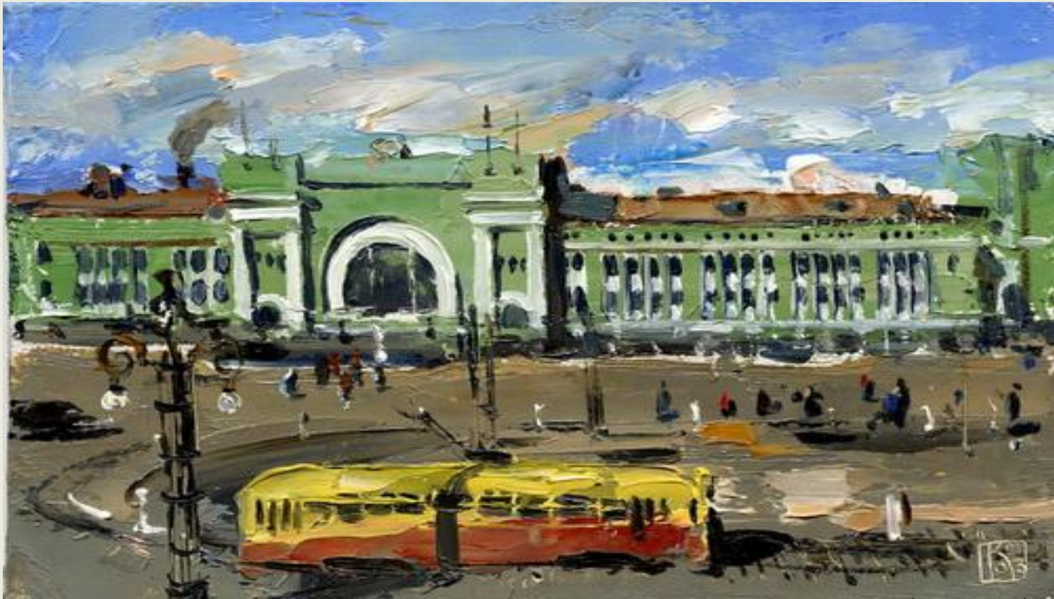
Казаковцев М. «Новосибирский вокзал» (2000-е гг.)

Новосибирский вокзал был построен еще в царское время, в 1894 году. Перроны напоминают филиал исторического музея: повсюду стоят скульптуры, установлены памятные таблички. Является одной из главных туристических достопримечательностей Сибири