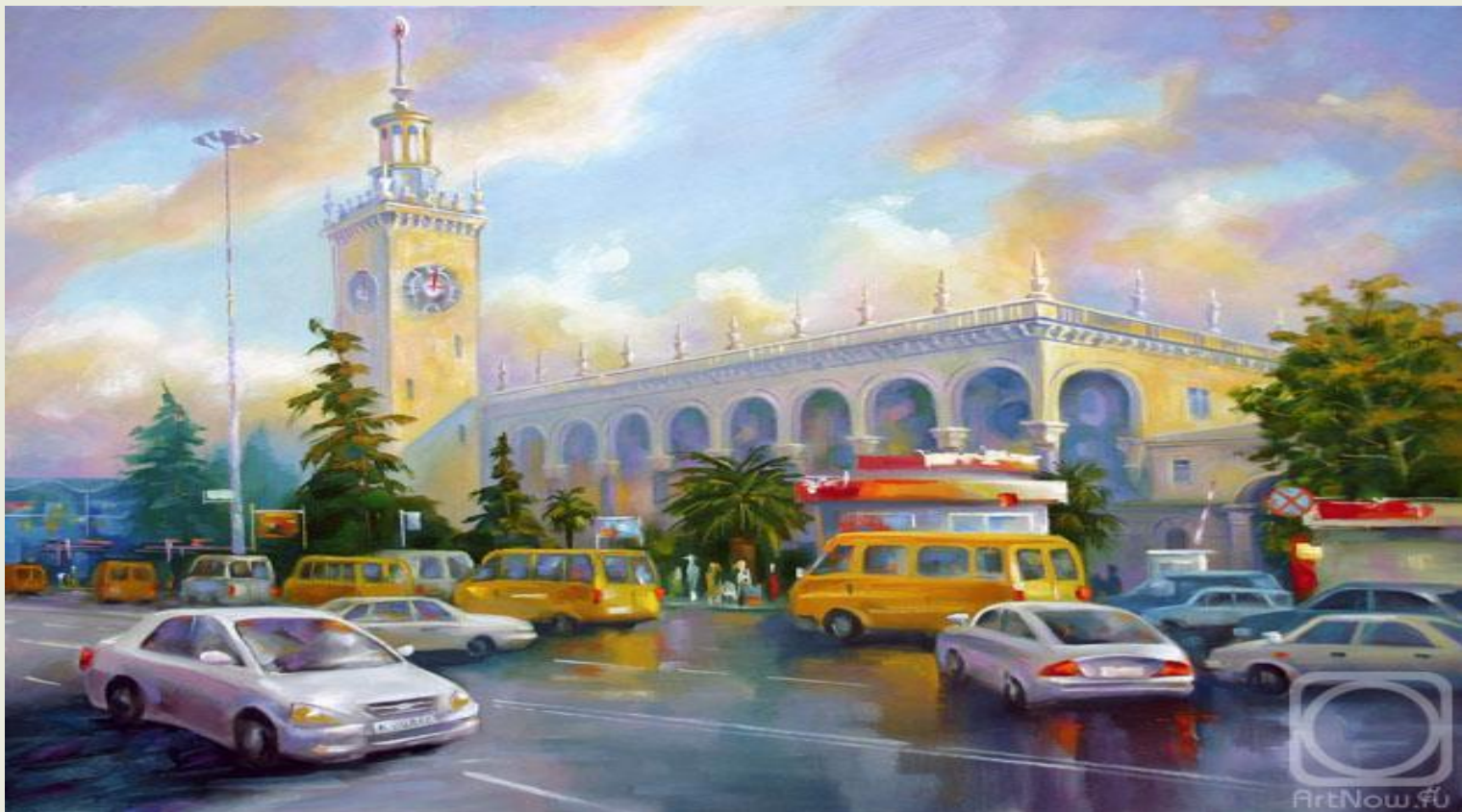
Сивенков Н. «Железнодорожный вокзал Сочи. После дождя» (2009 г.)

Сочинский - один из крупнейших вокзалов Краснодарского края. Если бы к этому зданию не приходили поезда, то в нем вполне мог бы поселиться какой-нибудь хан или шейх. Особый шарм зданию и прилегающей площади придает местная субтропическая растительность