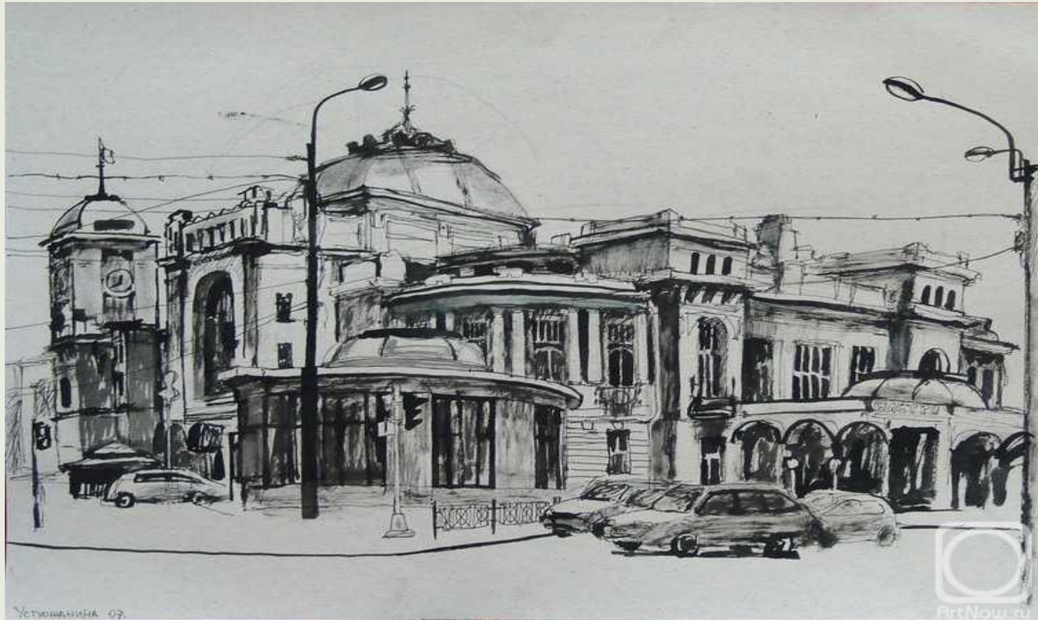
Устюжанина О. «Витебский вокзал» (2007 г.)

Витебский вокзал (ранее Царскосельский , затем — Детскосельский ). Один из пяти действующих вокзалов. Старейший железнодорожный вокзал в Санкт-Петербурге и России