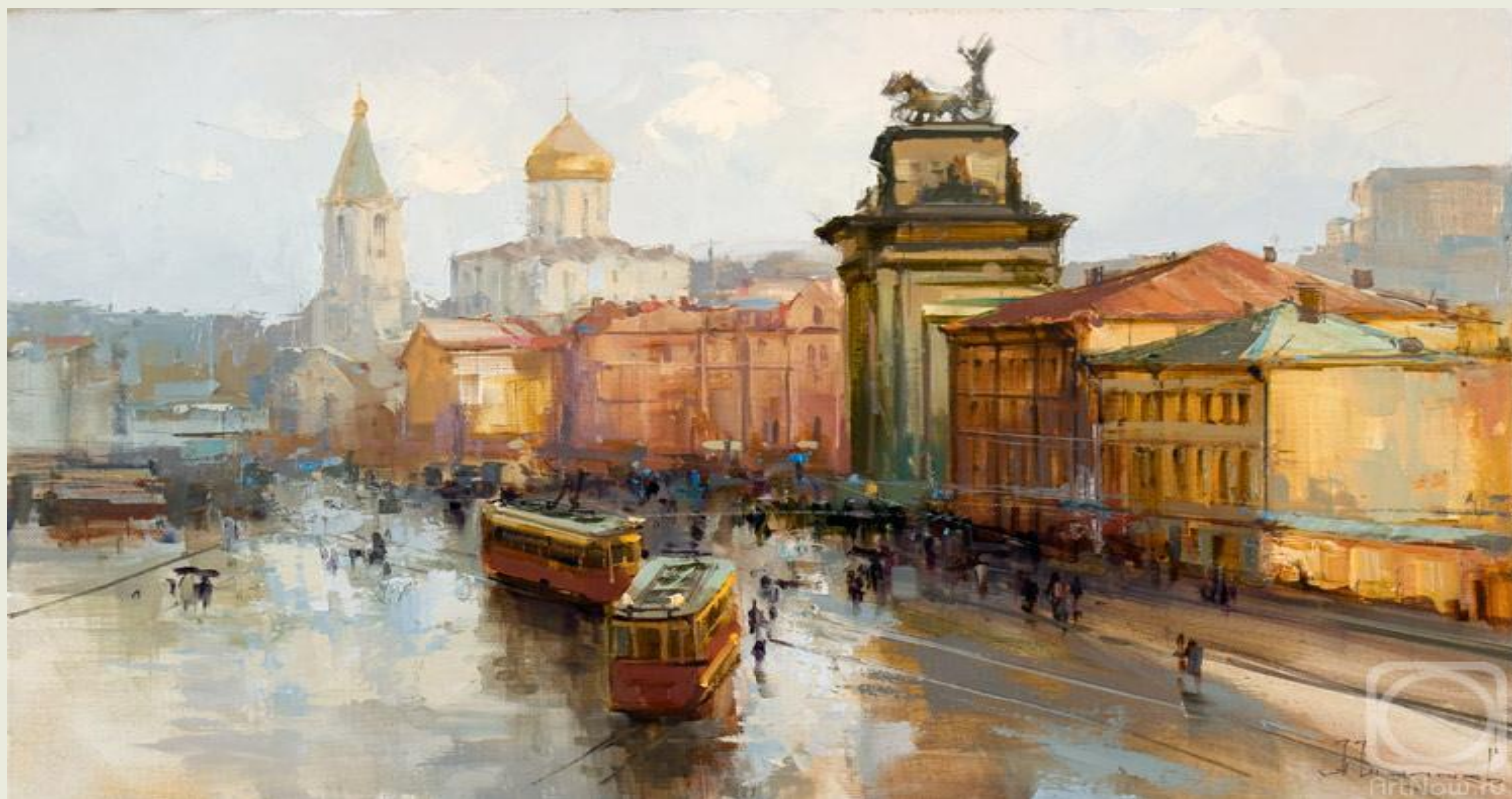
Шалаев А. «Площадь Белорусского вокзала»(2009 г.)

Белорусский вокзал (в 1870—1871 — Смоленский , в 1871—1912 и в 1917—1922 — Брестский , в 1912—1917 — Александровский , в 1922—1936 — Белорусско-Балтийский ) — железнодорожный вокзал Москвы. Расположен на площади Тверской заставы. От перронов Белорусского вокзала в 1941 году отправились на фронт первые эшелоны