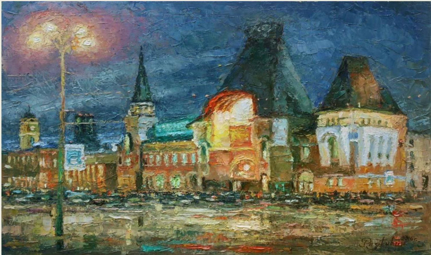
Разживин И. «Ярославский вокзал» (2014 г.)

Ярославский вокзал (до 1870 года — Троицкий , до 1922 года — Ярославский , до 1955 года — Северный ) – крупнейший по объему пассажирских перевозок, один из девяти вокзалов Москвы. Здание вокзала считается памятником русской архитектуры