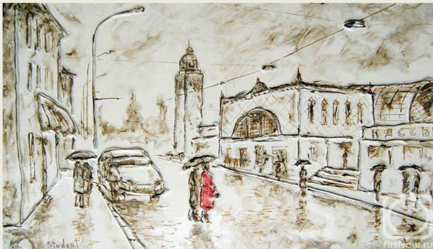
Студеникин Ю. «Дождь над Киевским вокзалом» (2005 г.)

Киевский вокзал (в 1918—1934 — Брянский ) — один из девяти железнодорожных вокзалов Москвы. Расположен на площади Киевского вокзала. Построенный в честь столетия Бородинской битвы, этот вокзал продолжает удивлять даже людей, привыкших много времени проводить на чемоданах