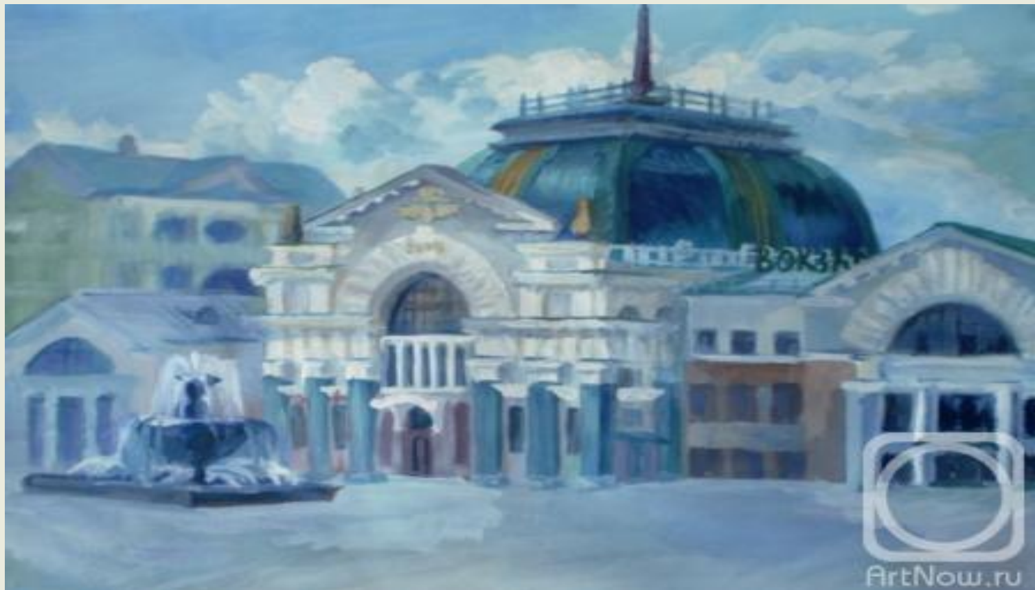
Козлова Н. «Железнодорожный вокзал Красноярска» (2008 г.)

Красноярский вокзал выполненный в неорусском стиле впечатляет приезжих гостей города. Привокзальная площадь является настоящей гордостью города, чему способствуют три шикарных фонтана, элегантные фонари и удобные скамейки