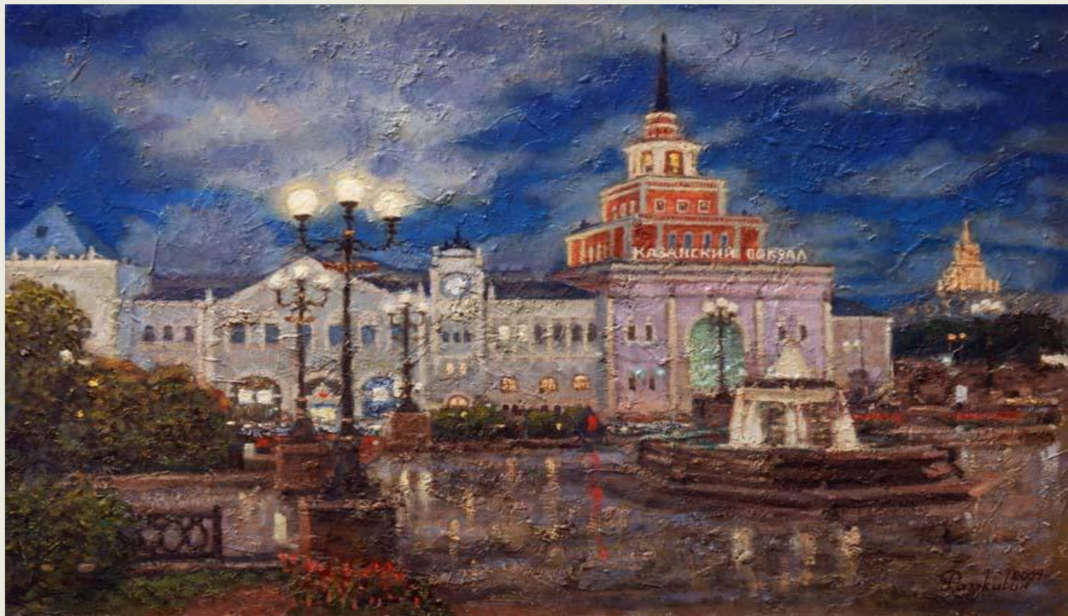
Разживин И. «Казанский вокзал» (2009 г.)

Казанский вокзал (до 1894 г. — Рязанский ) — один из московских вокзалов. Располагается на Комсомольской площади. 27 лет понадобилось для того, чтобы возвести один из самых больших вокзалов не только Москвы, но и Европы