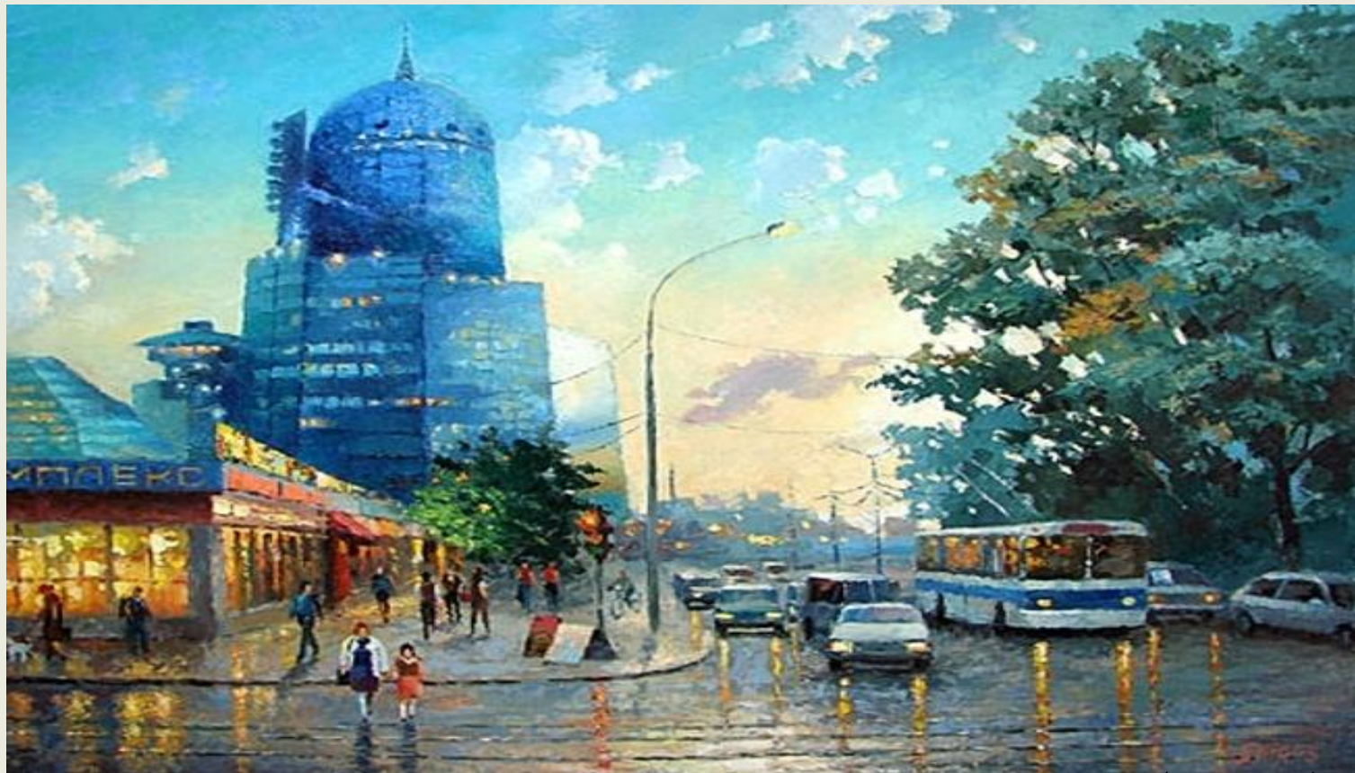
Спирос Д. «Вокзал в Самаре» (2000-е гг.)

Самарский вокзал — самый современный, как по хронологии, так и по внешнему виду. Считается не только одним из самых красивых, но и самым высоким вокзалом в Европе, чтобы убедиться в этом, достаточно лично посетить смотровую площадку, находящуюся на высоте 95 метров