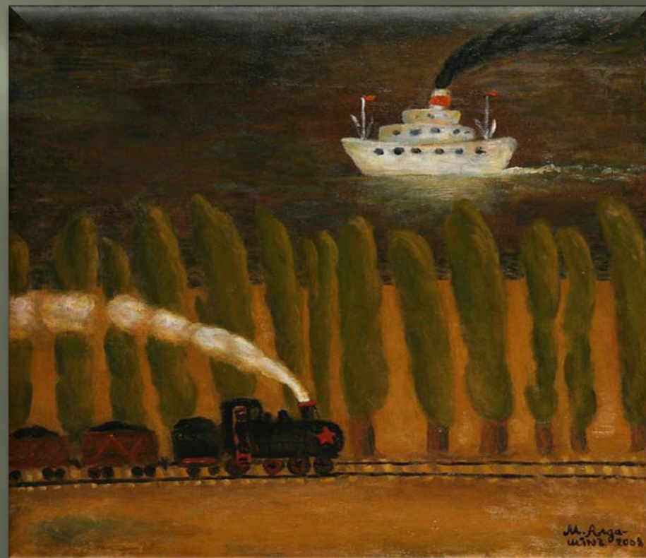
Алдашин А. «Паровоз и пароход» (2008 г.)