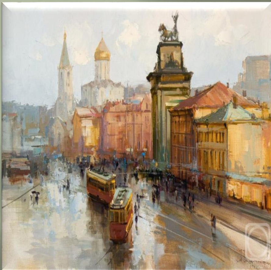
Шалаев А. «Площадь Белорусского вокзала» (2009 г.)