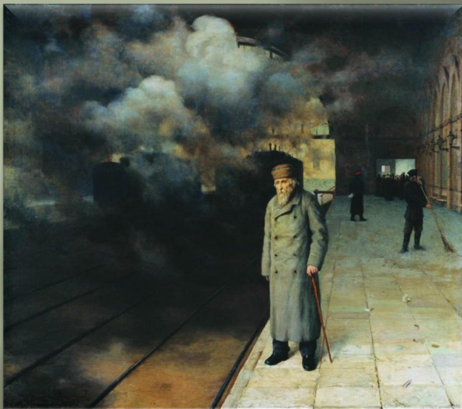
Ярошенко Н. «Проводил» (1891 г.)

Железнодорожная платформа редко изображается в светлых, оптимистических тонах. Гораздо чаще здесь царят грусть, тревога, отчуждение