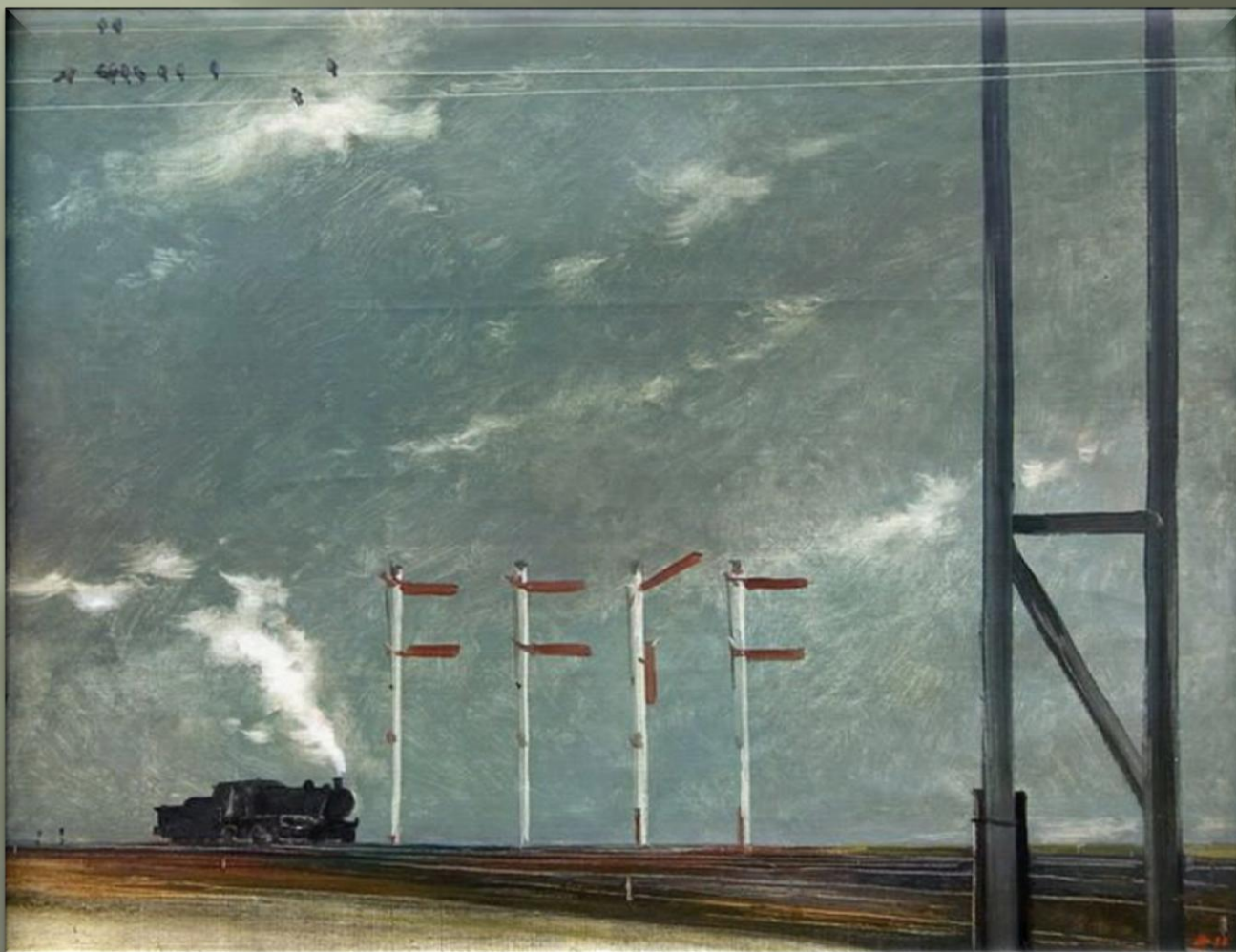
Нисский Г. «Осень. Семафоры» (1932 г.)

Важным техническим элементом железной дороги является семафор