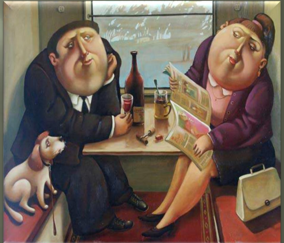
Иванов Б. «В поезде» (2000-е гг.)