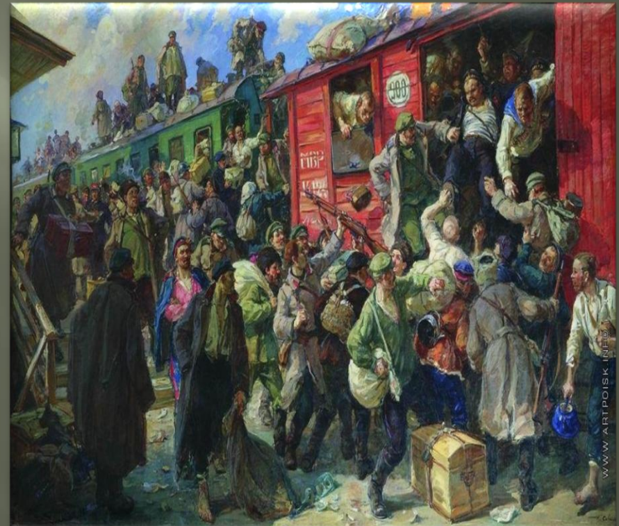
Савицкий Г. К. «Стихийная демобилизация красной армии в 1917 году» (1928 г.)