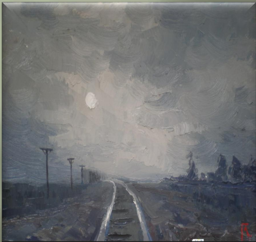
Головченко А. «Дорогой лунною» (2000-е гг.)

Железнодорожное полотно, рельсы, мост как элемент, включенный в окружающую действительность, встречаются на полотнах живописцев достаточно часто