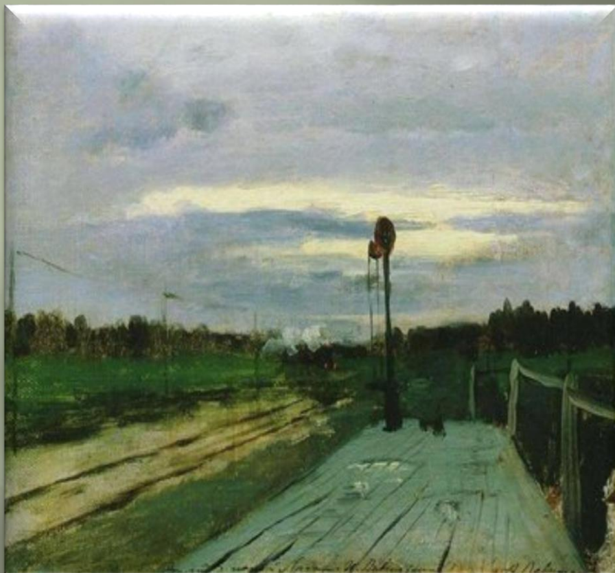
Левитан И. «Полустанок» (1879 г.)

Железная дорога вписывается в природную среду, становясь частью природного ландшафта