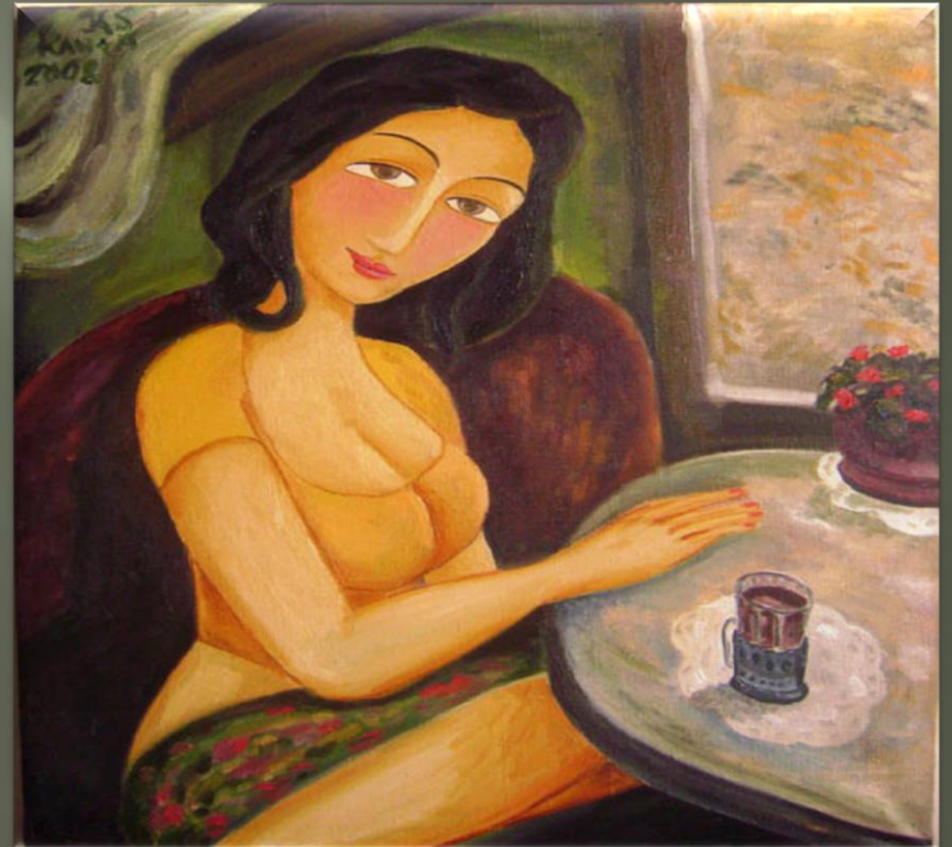
Силук К. «Девушка в купе» (2008 г.)