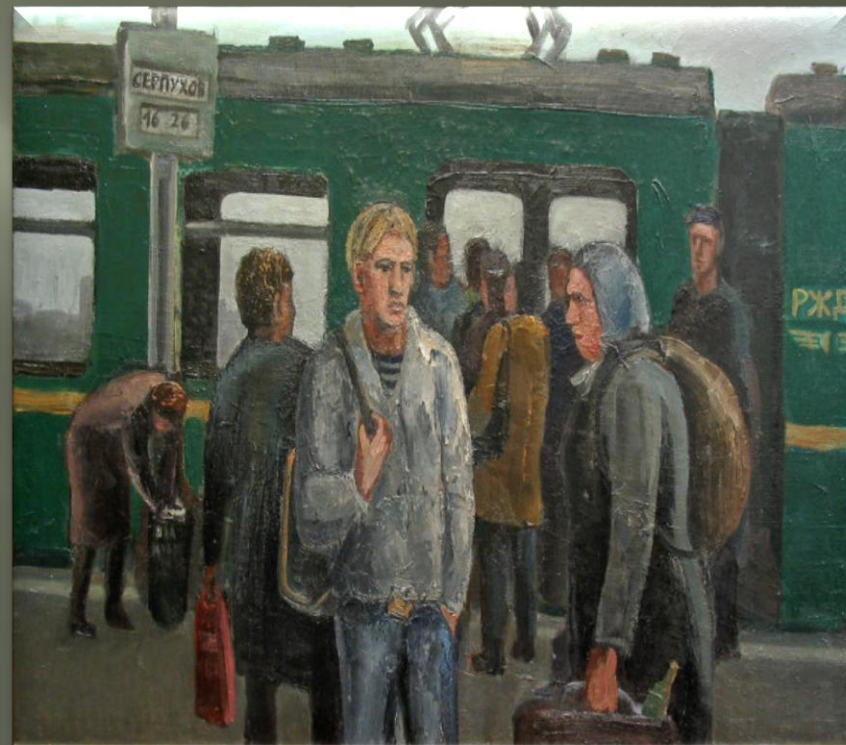
Помелов Ф. «Курский вокзал» (2004 г.)