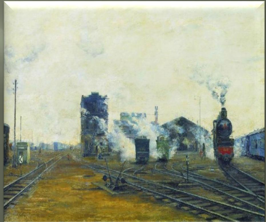
Яковлев Б. «Транспорт налаживается» (1923 г.)