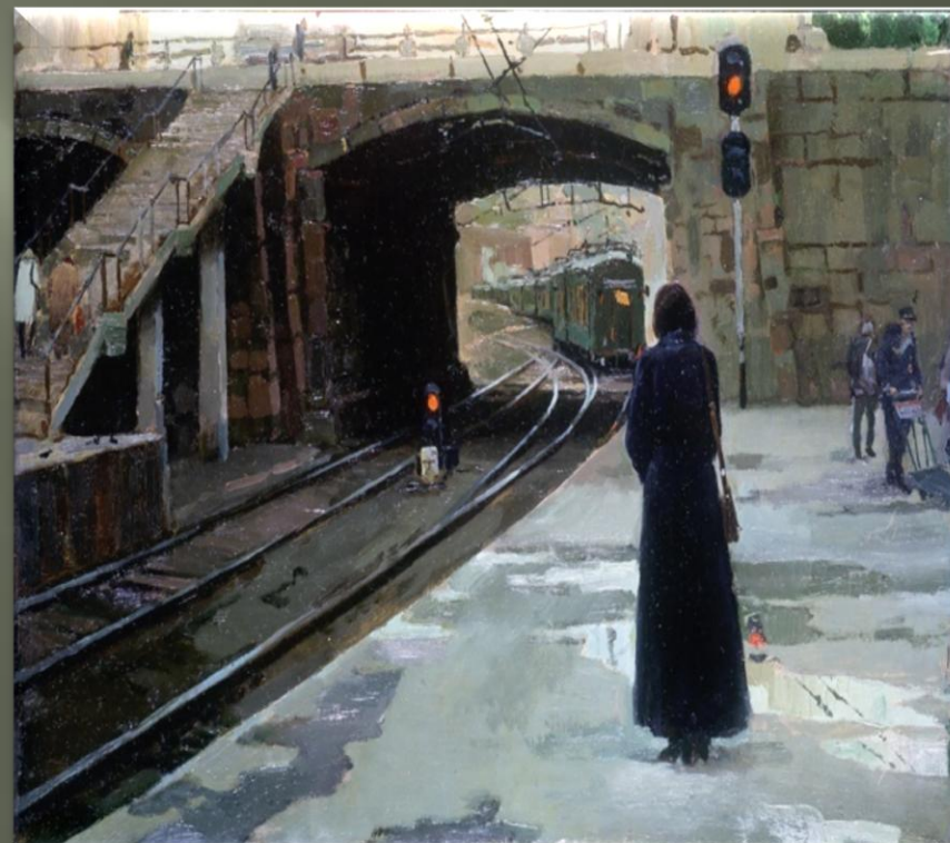
Алдошин Н. «Прощание на вокзале» (2007 г.)