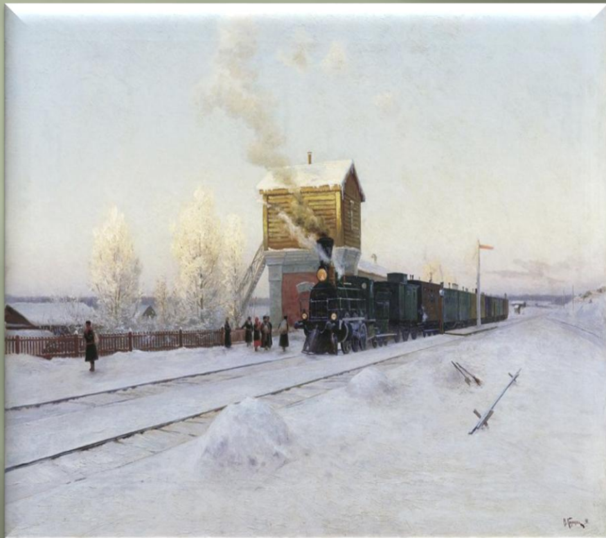
Казанцев В. «На полустанке. Зимнее утро на Уральской железной дороге» (1891 г.)

Однако главным героем произведений изобразительного искусства железнодорожной тематики является железнодорожный состав