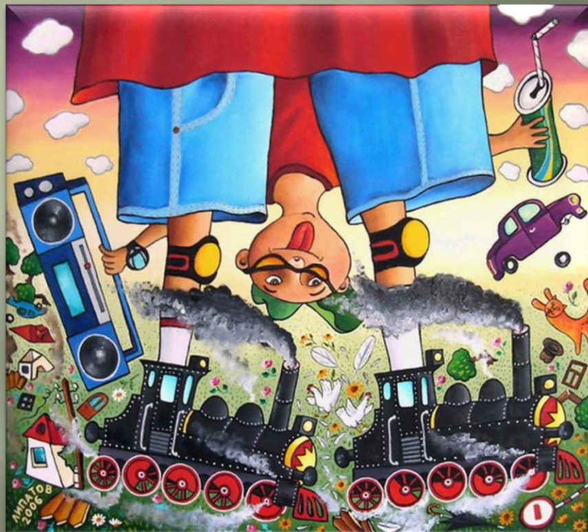
Липатов А. «Роллер» (2006 г.)

Интересным представляется видение железной дороги «наивными» художниками. Они словно играют с давно известными публике образами