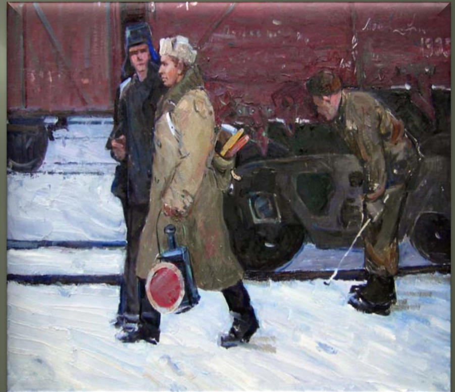
Федоренков Ю. «В рейс» (1964 г.)