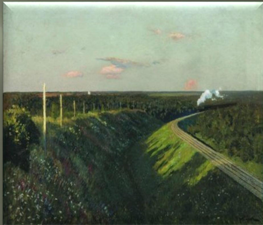
Левитан И. «Поезд в пути» (1890 г.)