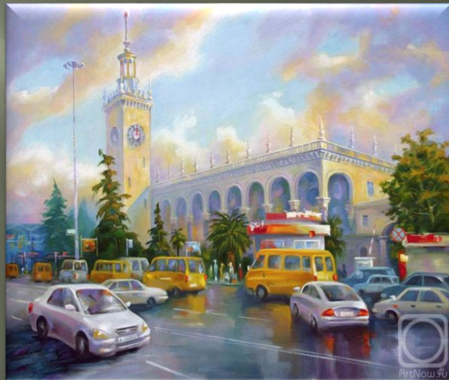
Сивенков Н. «Железнодорожный вокзал Сочи. После дождя» (2009 г.)