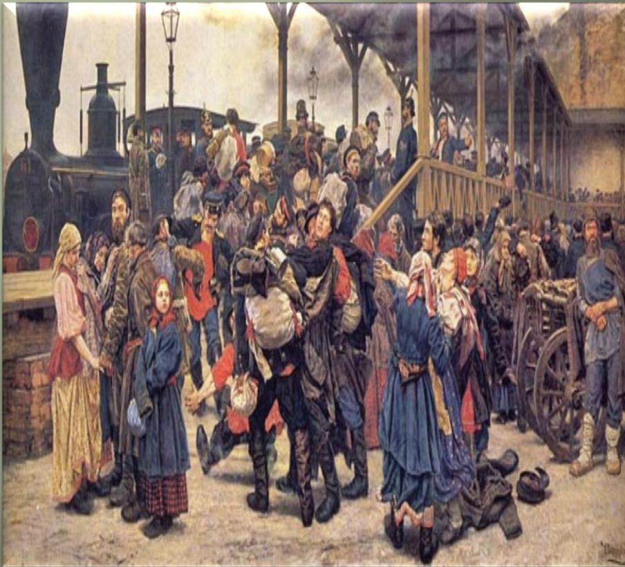
Савицкий К. А. «На войну» (1888 г.)