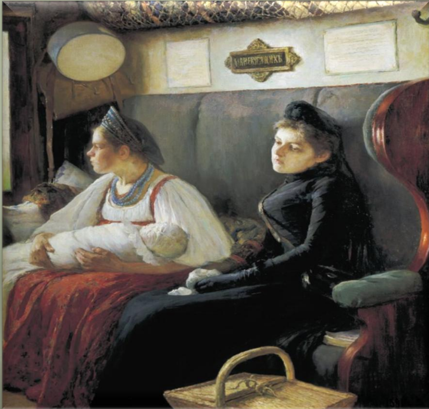
Пастернак Л. «К родным» (1891 г.)