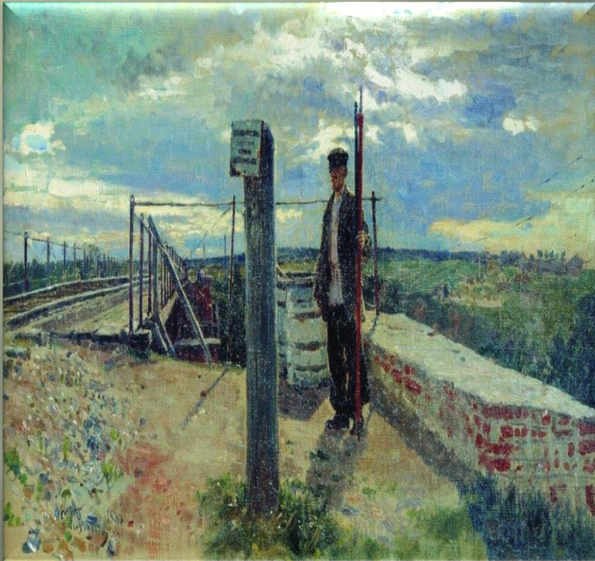
Репин И. «Железнодорожный сторож. Хотьково» (1882 г.)