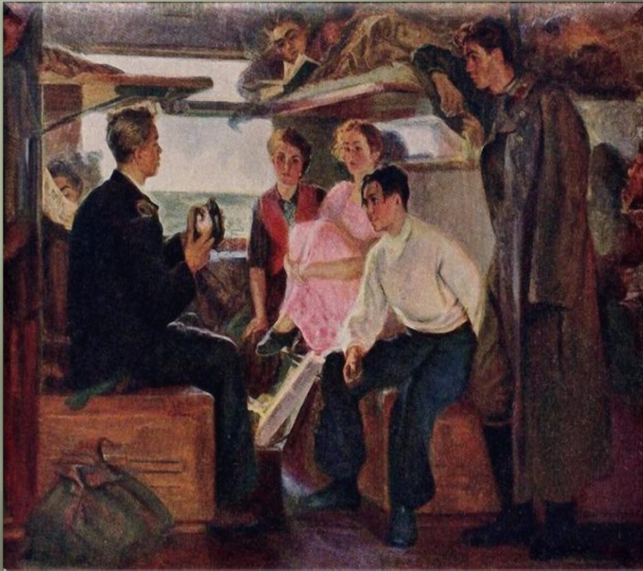
Толстая Т. «В пути» (1955 г.)