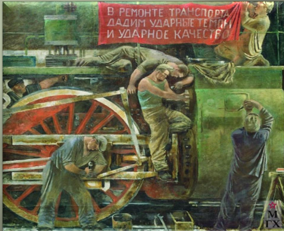
Самохвалов А. «Ремонт паровоза» (1931 г.)

Через образ железной дороги выражается пафос преобразований – люди подчиняют мощную технику