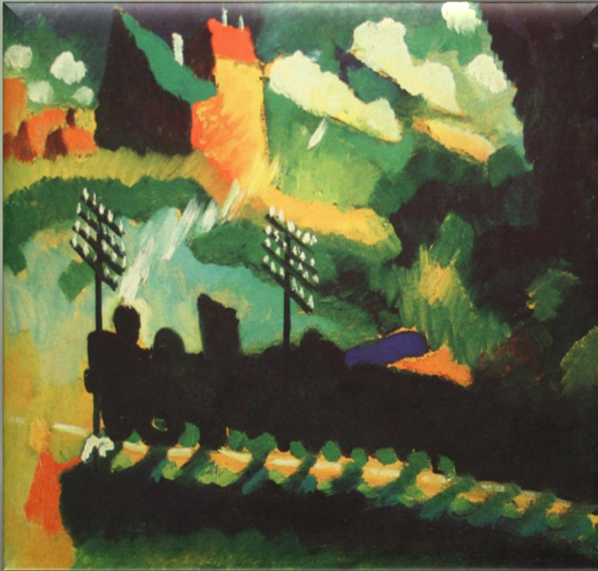
Кандинский В. «Вид Мурнау с железной дорогой» (1910 г.)