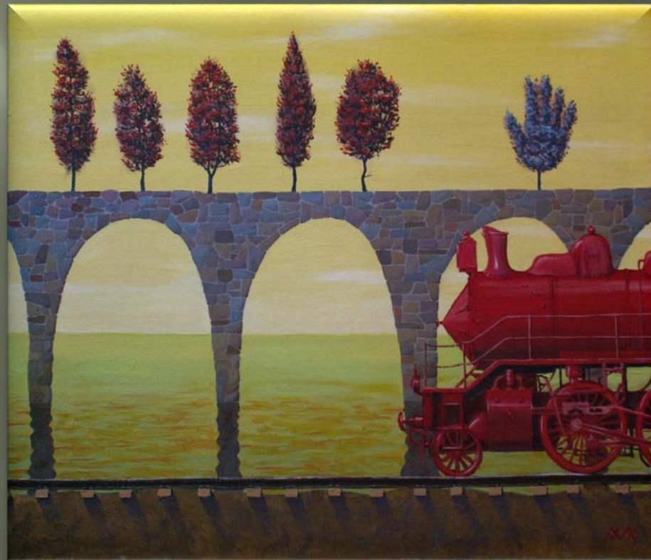
Масленников Е. «Красный паровоз» (2007 г.)