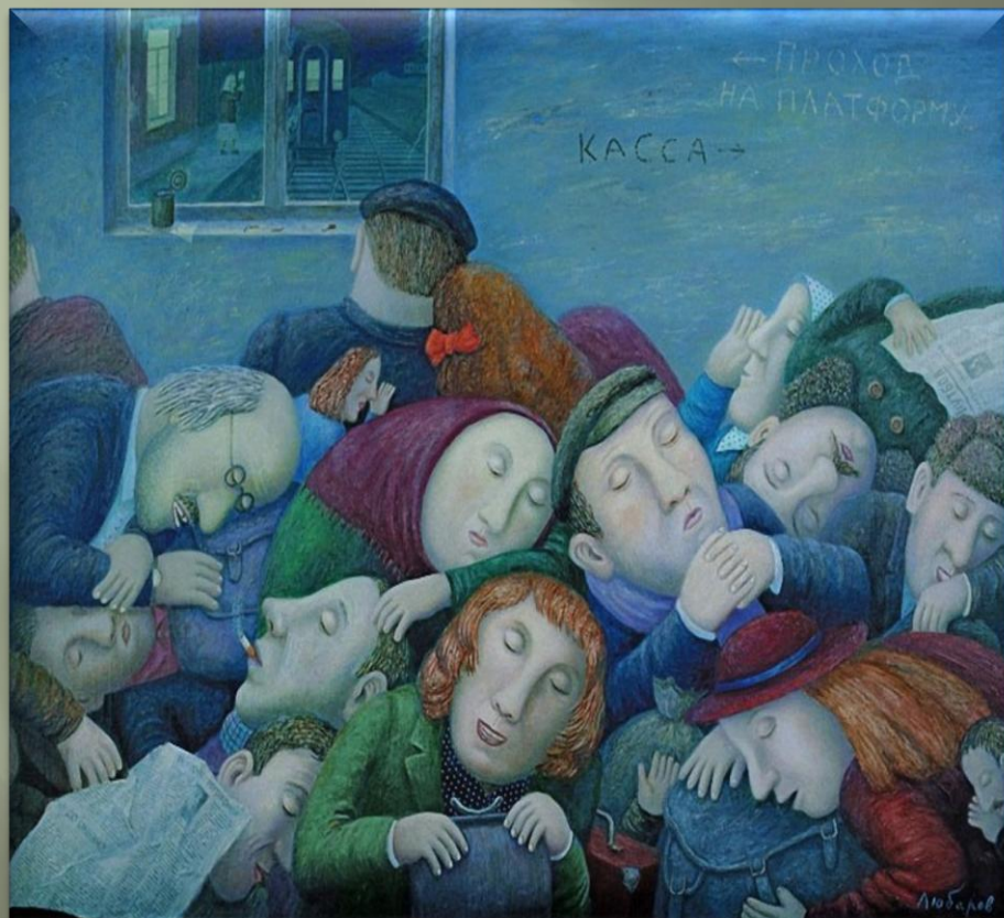
Любаров В. «Зал ожидания» (1998 г.)

Интерьер вокзала обычно наполнен людьми - ожидающими своего рейса, встречающими или провожающими